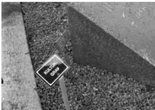
Kulturgravarna märks ut med en liten skylt i direkt anslutning till graven