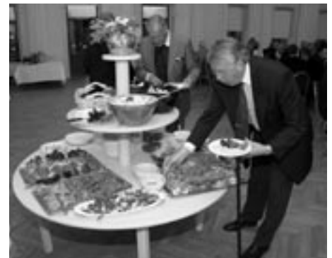
Kvällen avslutades med en läcker supé