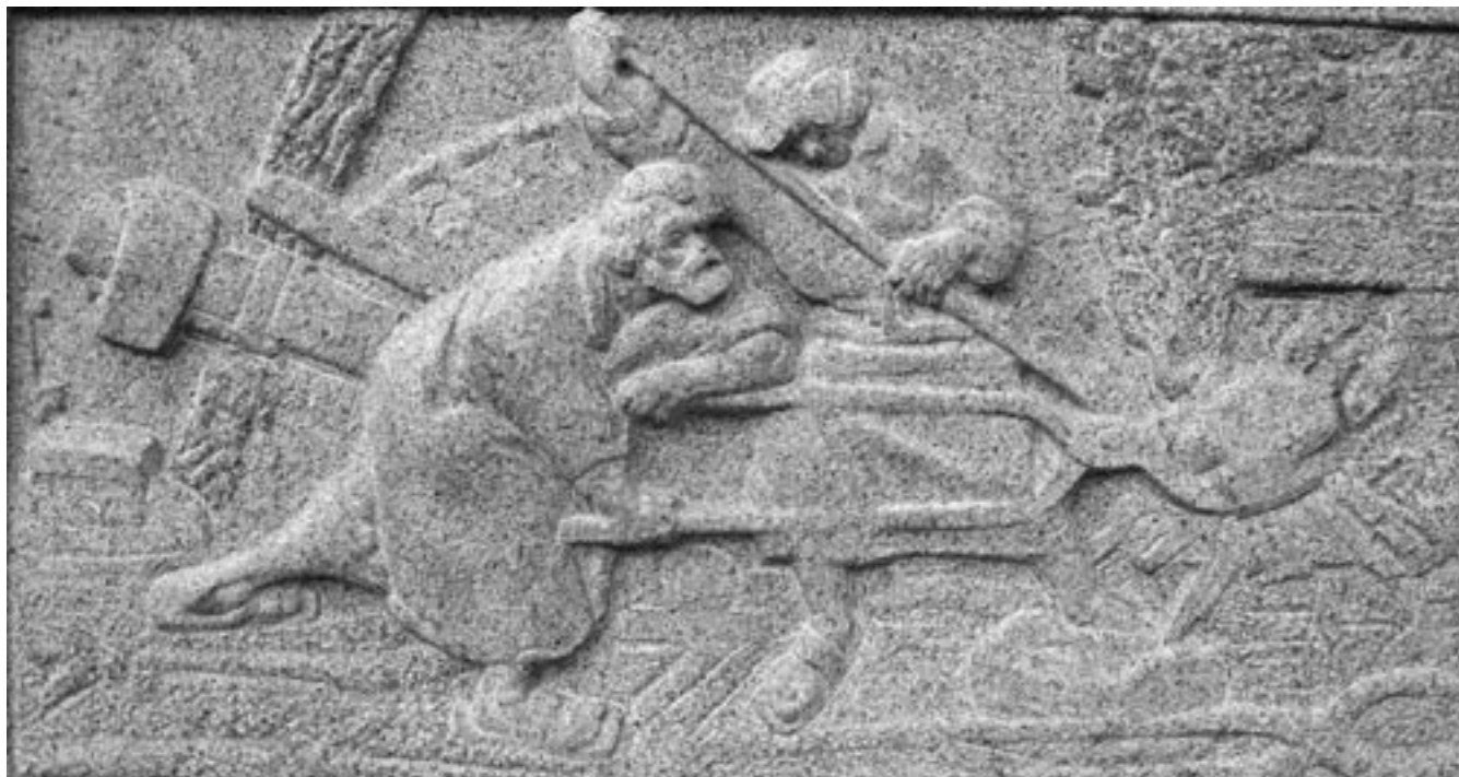
Detalj som visar smeder i en stångjärnsmedja på sockeln till Christian Erikssons staty av Karl IX

uppställning i närheten av kyrkan. När sedan Ragnar Östberg föreslog statyns placering mitt framför residenset men åt älven till, enades man därom. Den 19 juni 1926 skedde där avtäckningen av Konungen under enorm tillslutning av åskådare från snart sagt hela Värmland. Ca 15 000 personer beräknas ha deltagit i firandet av de båda majestäten. Den ende, som saknades såväl vid själva högtidligheten som vid stadens middag efteråt, var förstås Christian Eriksson. Men kommandörstecknet av andra klass av Vasaorden samt i textad, varmt uppskattande hyllningsadress från samtliga statykommittéerade kommo sedan per post.