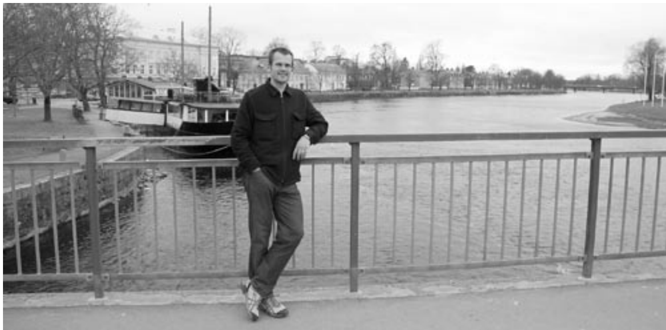
På Västra bron med Almenbebyggelsen och Klarälven i bakgrunden