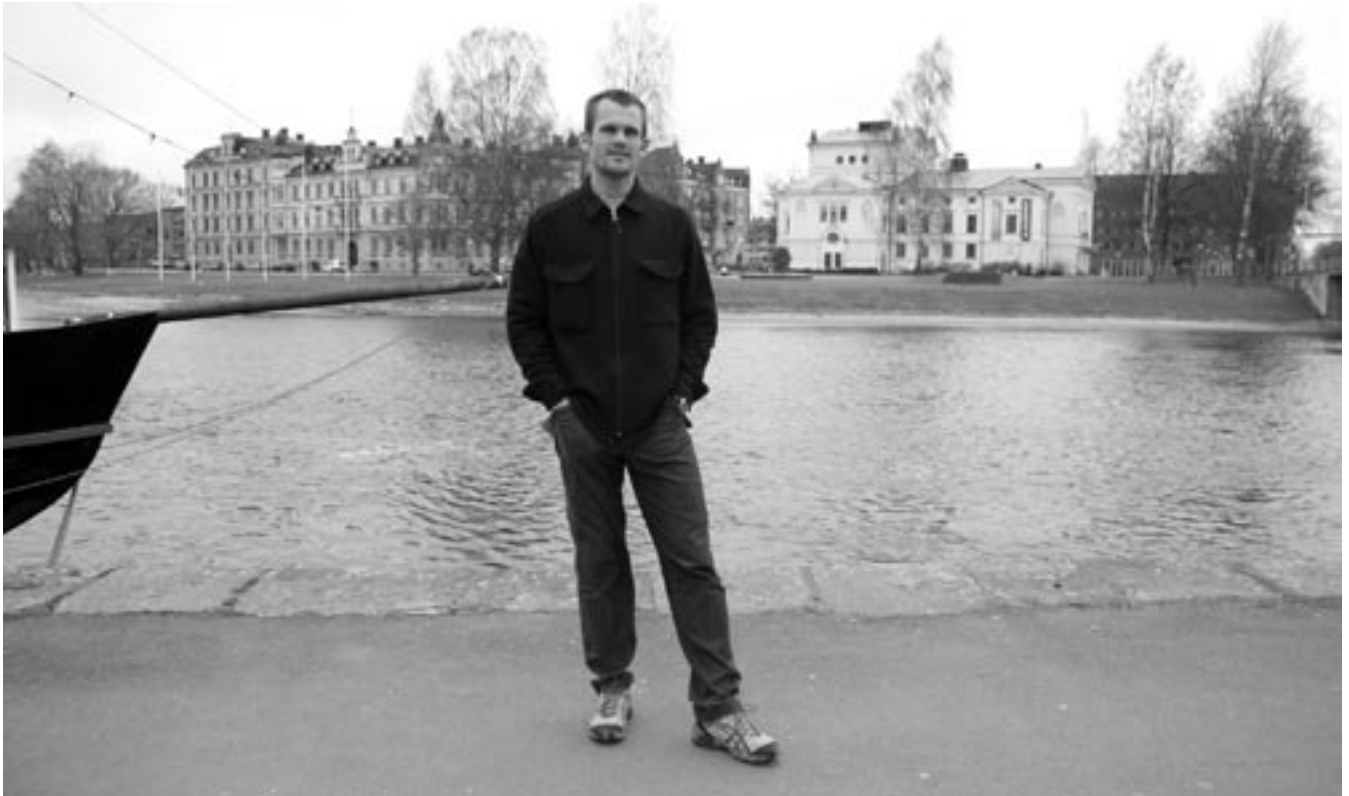
Stefan Holm framför Sockerslottet och Karlstads teater