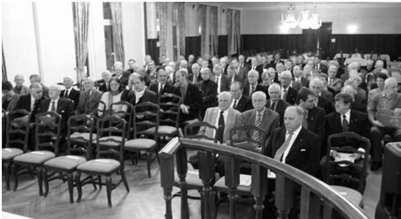
Cirka 110 medlemmar hade infunnit sig till 2004 års höstgille