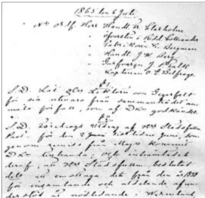
Inledningen på protokoll från Stadsfullmäktiges sammanträde den 6 juli 1865